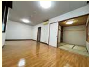
2人部屋（和室・フローリング付き）