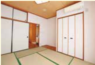
1人部屋（和室・フローリング） ※和室・フローリングは選べません